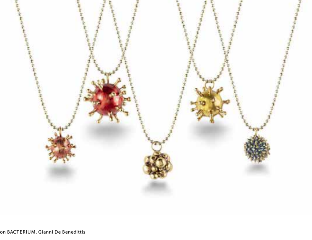
( ) Capsule collection BACTERIUM, Gianni De Benedittis

Tra tutti spicca proprio Gianni De Benedittis che presenterà CARNIVOROUS, la nuova collezione Spring-Summer 2020 di futuroRemoto.