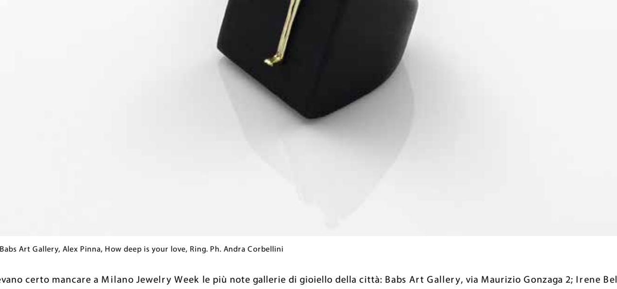
Babs Art Gallery, Alex Pinna, How deep is your love, Ring, Ph. Andrea Corbellini

VS Gallery in via Civissimo 11 e Galleria Pa.Nova in via Palermo 11, tra i più noti "indirizzi d'arte" di Brera, ospiteranno rispettivamente le creazioni contemporanee di Galleria Alice Floriano (Brasile) e alcuni singolari pezzi di artisti internazionali selezionati da INTHEPENDANT Contemporary Jewellery Gallery (Portogallo).