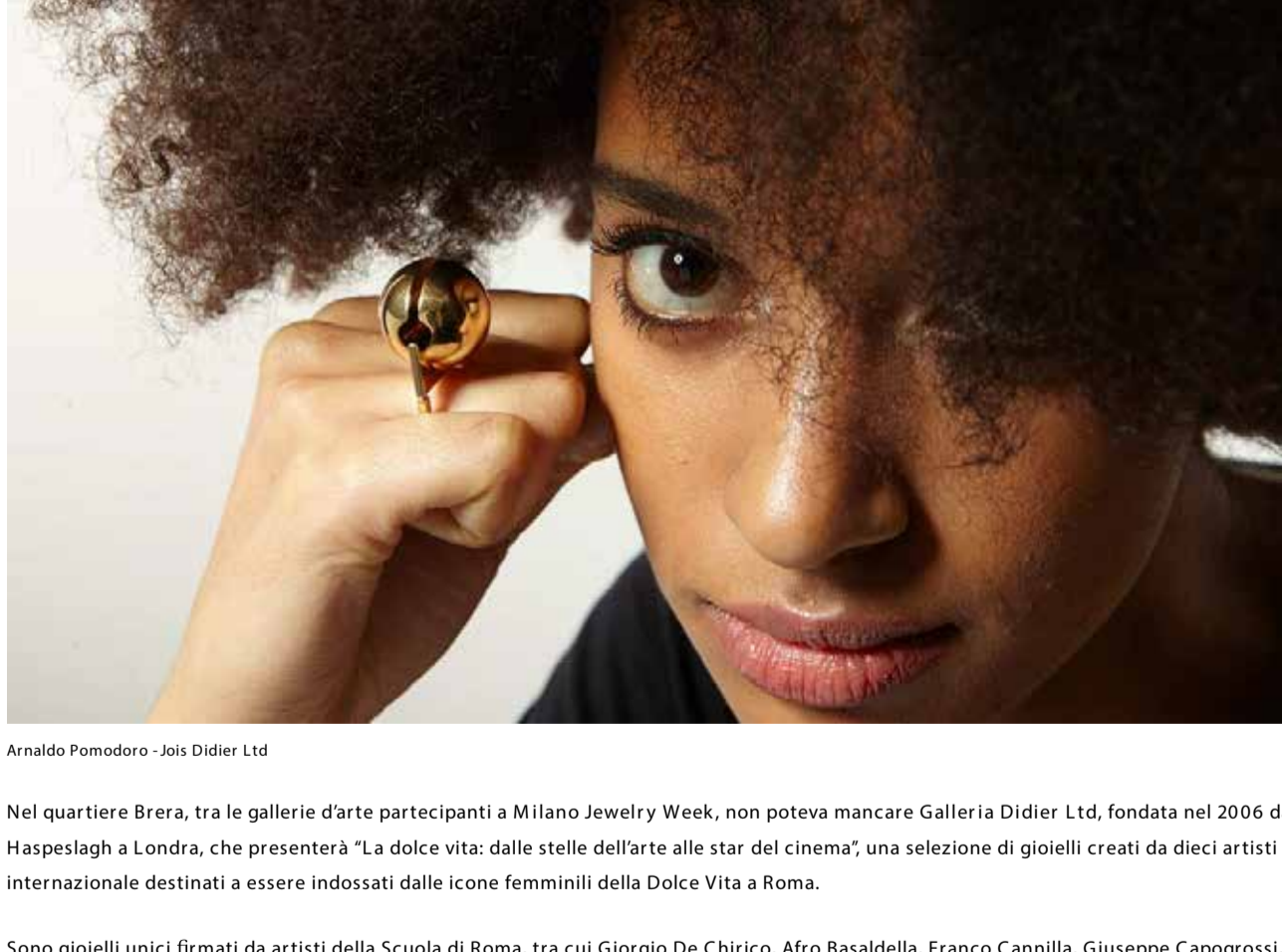
Arnaldo Pomodoro - Jois Didier Ltd

Inoltre, si potranno ammirare gioielli che rappresentano l'eccellenza delle diverse tecniche orafe: alta oreficeria e gioielleria, incisione, smalto a fuoco, sbalzo e cesello, incastonatura, micro scultura in cera.