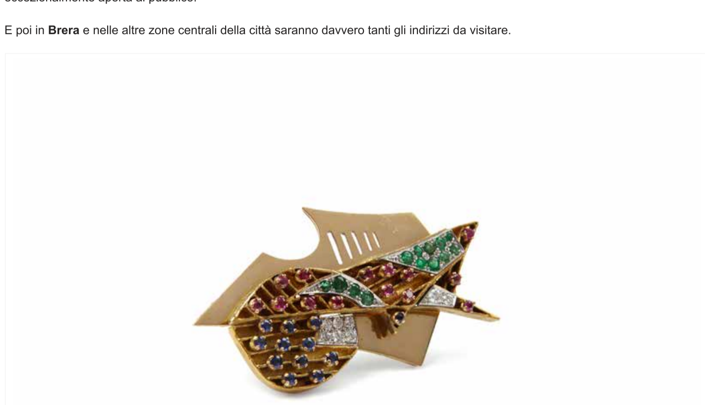
Gino Severini Brooch Didier Ltd

E poi in Brera e nelle altre zone centrali della città saranno davvero tanti gli indirizzi da visitare.