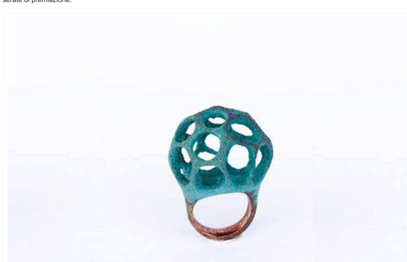
Lorenzo Pepe Ring

ci saranno anche mostre collettive e personali, esposizioni di gallerie e scuole internazionali, workshop, performance, temporary shop e serate di premiazione.