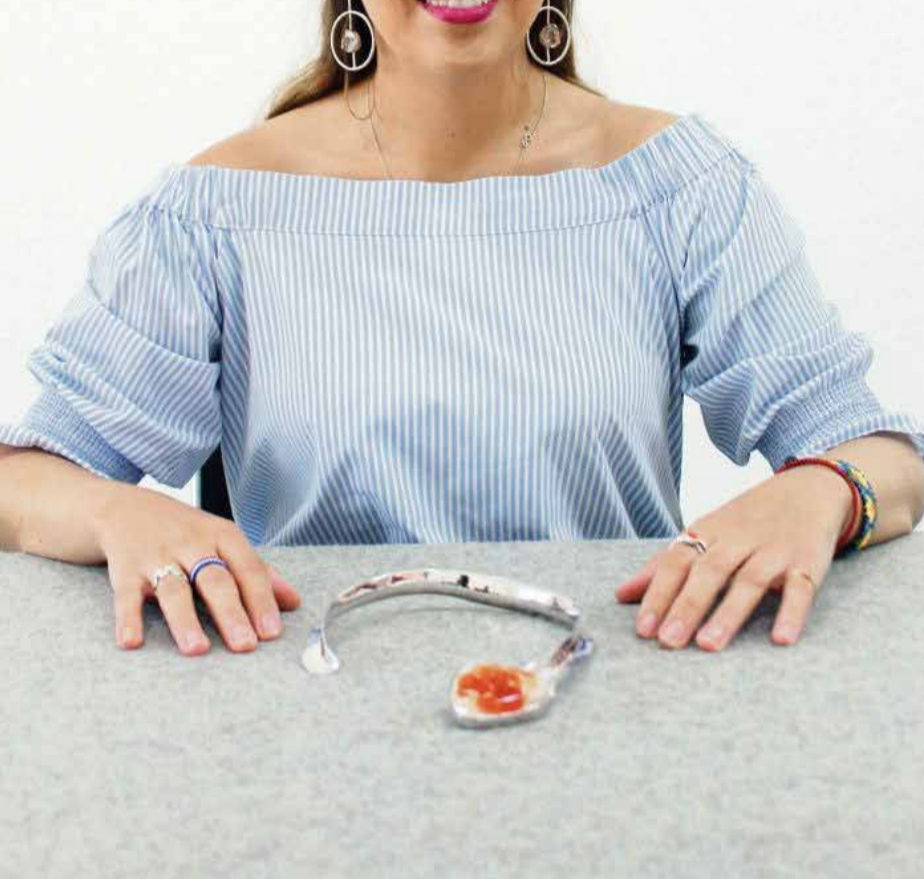
Pieza: "Un regalo para Ama San"