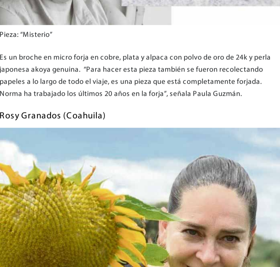
Pieza: "Gargantilla de fuego"

La pieza está hecha en forja en plata y ópalo de fuego genuino. "Esta piedra, el ópalo de fuego es originaria de México (de Magdalena, Jalisco) y representa que todos tenemos un fuego al fondo del pecho y a veces nos olvidamos que está ahí para atrevernos a hacer cosas".