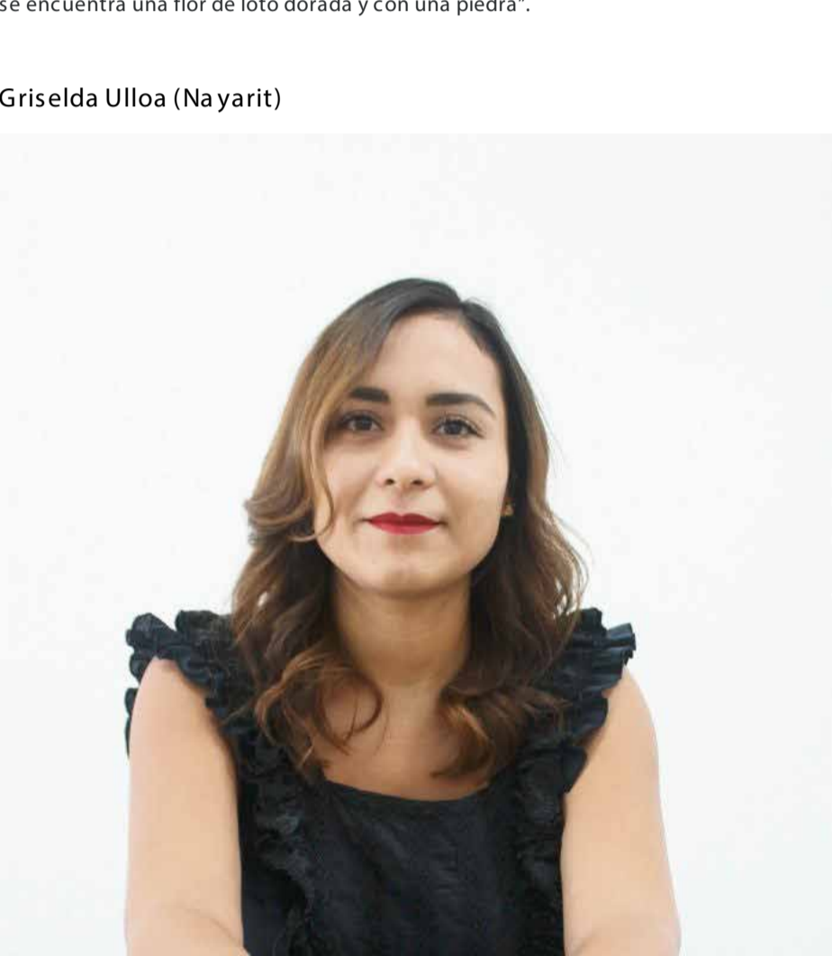
Pieza: "Búsqueda interna"

Impresión 3D, vaciado a la cera perdida en plata con baño de rodio y oro y diamante genuino pertenece a una colección inspirada en el despertar, llamada "A wake up forever". "La pieza está basada en elementos budistas, esta pieza representa una flor en botón, la argolla es la cabeza de flor y está forjada sobre su cabeza, por dentro se encuentra una flor de loto dorada y con una piedra".