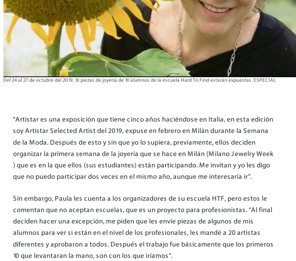
Del 24 al 27 de octubre del 2019, 10 piezas de joyería de 10 alumnos de la escuela Hard To Find estarán expuestas. ESPECIAL

Por: Enrique Esparza Rodríguez 15 de Septiembre de 2019 - 04:10 hs