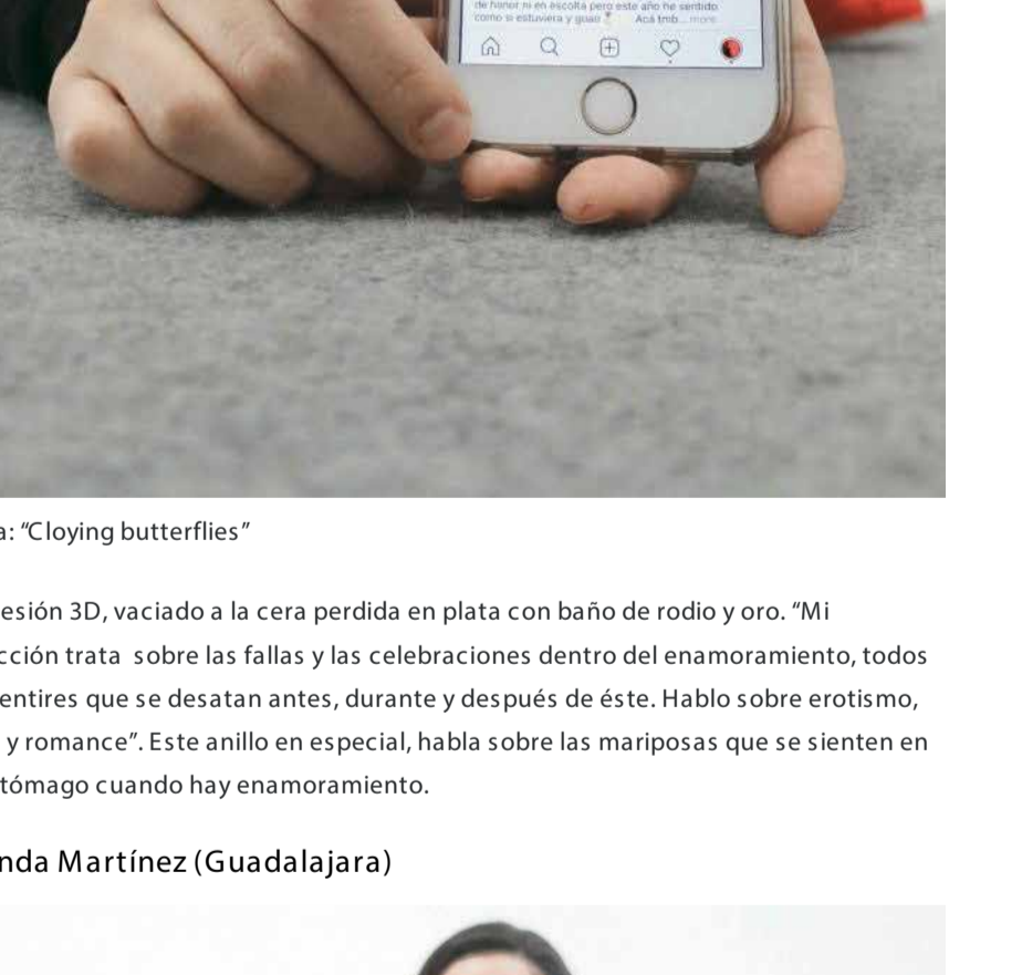
Pieza: "My mouth"