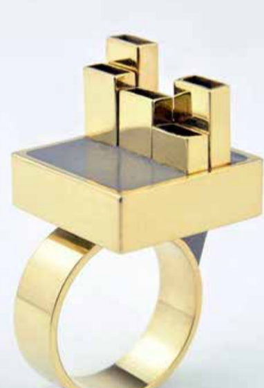
Lunante, New York, Urban Skyline