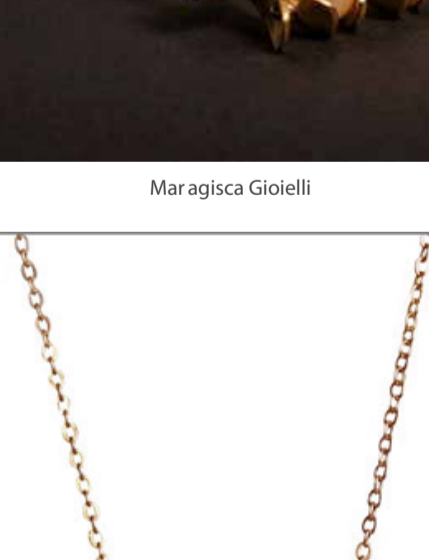
Opiummaginarium, Mini Theatrical Nature