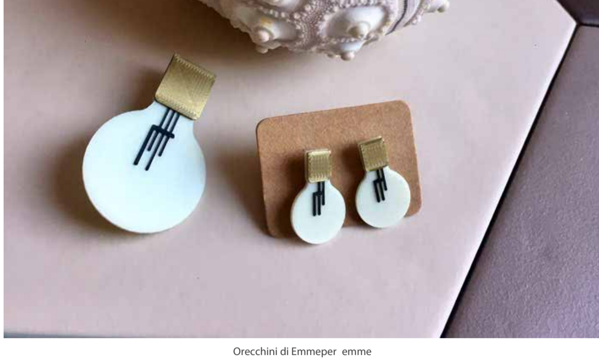
Orecchini di Emmepemme

Ci sono pezzi unici ed edizioni limitate di Antonio Giuliani, AZ Contemporary Jewels, Clizia Ornat o, Ellence, Emmepemme, Francesco Ridolfi, Glowing, Icardal, Lalice Arte Orafa, Larissa Rovati, Lunante, Margisca, Opium Imaginarium, PaScA Design, Teresa Rosalini, Vanesi, Werner Altinger. Gioielli che rappresentano diverse tecniche di lavorazione: da quelle più tradizionali come la microlusione e l'incisione a bulino sino a processi più moderni come il taglio laser e la modellazione in 3D; tra i materiali impiegati: dal classico oro e argento, terracotta e ceramica, fino a proposte più contemporanee come le resine e i materiali plastici.