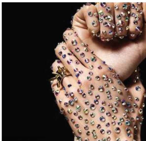
ts - Bing Pulp - Artistar Jewels 2019