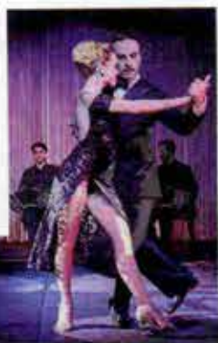
Uno spettacolo di Porteño Prohibido.

Amanti della danza, attenzione: a Milano è arrivata la prima casa de tango . A "El Porteño Prohibido" ballerini si esibiscono con orchestre di tango e cantanti. Aperitivo, cena e spettacolo "Prohibido": opera teatral-musicale di Miguel Angel Zotto.