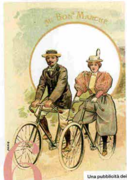
Una pubblicità dei grandi magazzini Au Bon Marché di Parigi del 1899.

Monili da far girare la testa non solo per gemme preziose, ma per originalità. Dal 24 al 27 ottobre ecco la prima edizione di Milano Jewelry Week : circa 80 eventi tra atelier di gioielleria, laboratori orafi, scuole e gallerie d'arte (info su milanojewelryweek.com ).