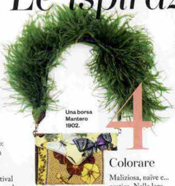
Una borsa Mantero 1902.