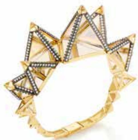
In foto: Bia Tambelli Creations, Trinity, Bracciale Trinity, oro 18k, diamanti brown, cristalli di rocca, quarzi citrini, 2018