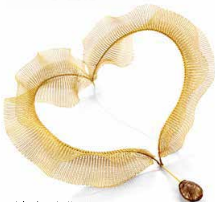
In foto: Sowon Joo, Heart