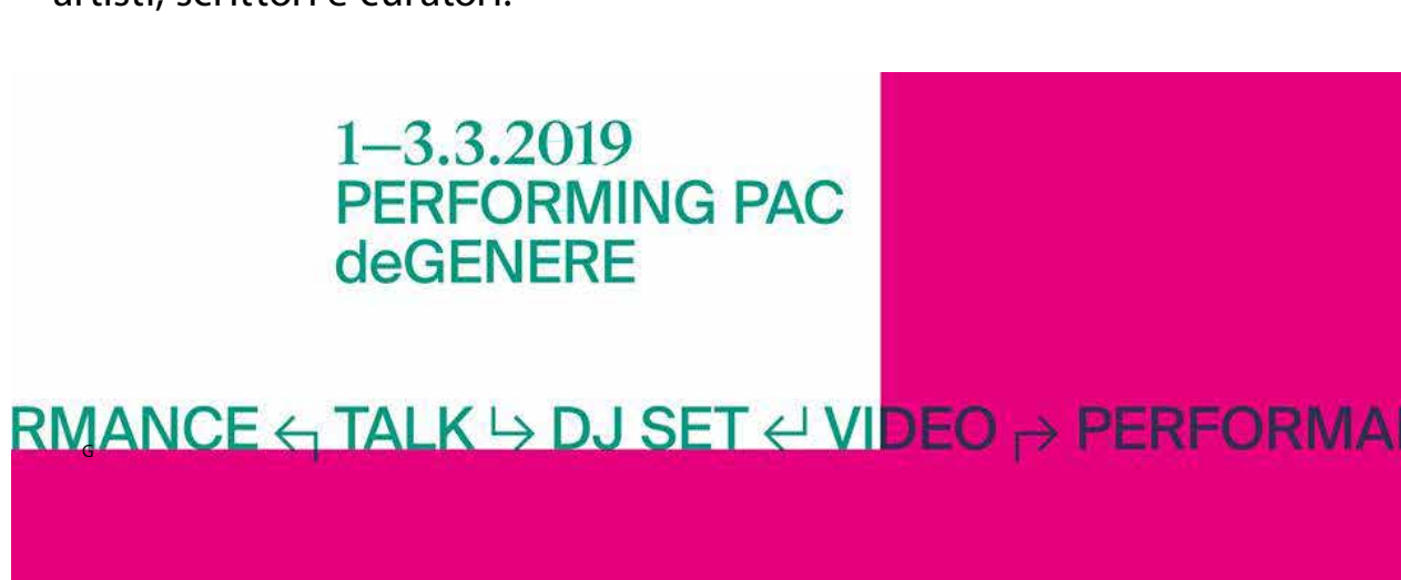
Performing PAC

Performing PAC al PAC: e come ogni anno torna la consueta 3 giorni del PAC con Performing PAC , manifestazione che quest'anno vedrà come tema principale l'identità di genere, politica, culturale e sociale. A essere protagonisti del museo, dal 1 marzo al 3 marzo, una performance, uno spettacolo teatrale, 5 opere video e 1 dj set che analizzeranno il tema dell'identità nelle sue diverse declinazioni. Presenti anche studiosi, artisti, scrittori e curatori.