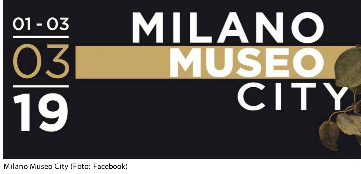
Milano Museo City

Milano MuseoCity 2019: dall'1 al 3 marzo 2019 è il momento della terza edizione di Milano MuseoCity , l'iniziativa dedicata alla scoperta dello straordinario patrimonio artistico di Milano. Una tre giorni in cui molti musei apriranno le porte al pubblico, non senza offrire visite guidate, incontri tematici e laboratori per bambini. Promossa dal Comune di Milano e realizzata in collaborazione con l'Associazione Milano MuseoCity, è un'ottima occasione per scoprire e approfondire tutto il bello che hanno da offrire i musei milanesi.