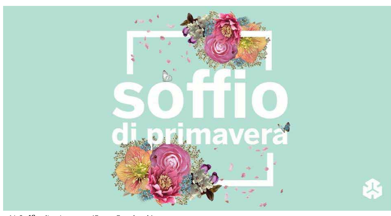
Al Soffio di primavera

FAI Soffio di primavera a Villa Necchi Campiglio: Sabato 2 e domenica 3 marzo torna FAI Soffio di primavera , la mostra mercato giunta ormai all'ottava edizione. Protagonisti, i fiori: un'occasione unica per conoscere e acquistare alcune specie di rose di Natale, erbacee perenni e rustiche. Il loro fascino è dovuto alla fioritura precoce, profumato presagio della bella stagione. E se vi sembrerà di averli già visti da qualche parte, sappiate che avrete ragione: sono proprio questi fiori quelli sotto i piedi di Venere ne La Primavera del Botticelli . Da non perdere per gli appassionati di giardinaggio.