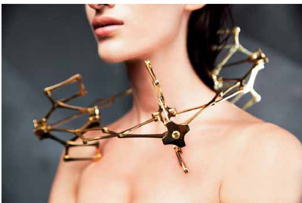
Vertigo Jewelry by Viktoriya Strizhak