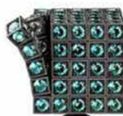
Vlad Glynnin-Cubed Cube