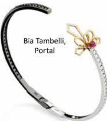
Bia Tambelli, Portal