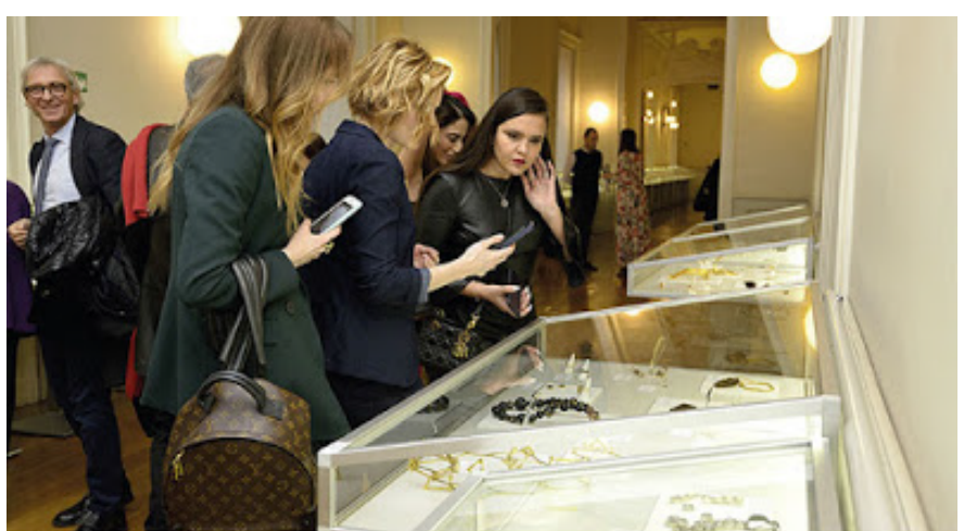
Artistar Jewels Exhibition 2018