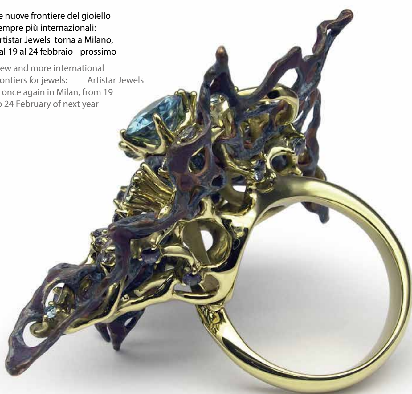
STANISLAV DROKIN Two Rivers ring

New and more international frontiers for jewels: Artistar Jewels is once again in Milan, from 19 to 24 February of next year