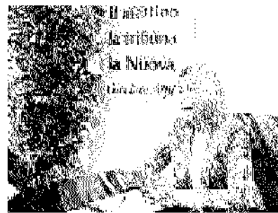
L'assessore regionale Manuela Lanzarin

alcun "contenuto" per il Sant'Antonio, salvo la sua cessione in comodato d'uso gratuito all'Azienda ospedaliera Università di Padova, decretandone la fuoriuscita dalla gestione dell'Usl 6 Euganea. Petizioni, sit in e assemblee promosse dal Comitato Sos Sant'Antonio che raggruppa tutti i soggetti che si oppongono alle previsioni delle schede sembrano aver convinto l'assessore a una linea più morbida. LIVIERI / APAG. 23