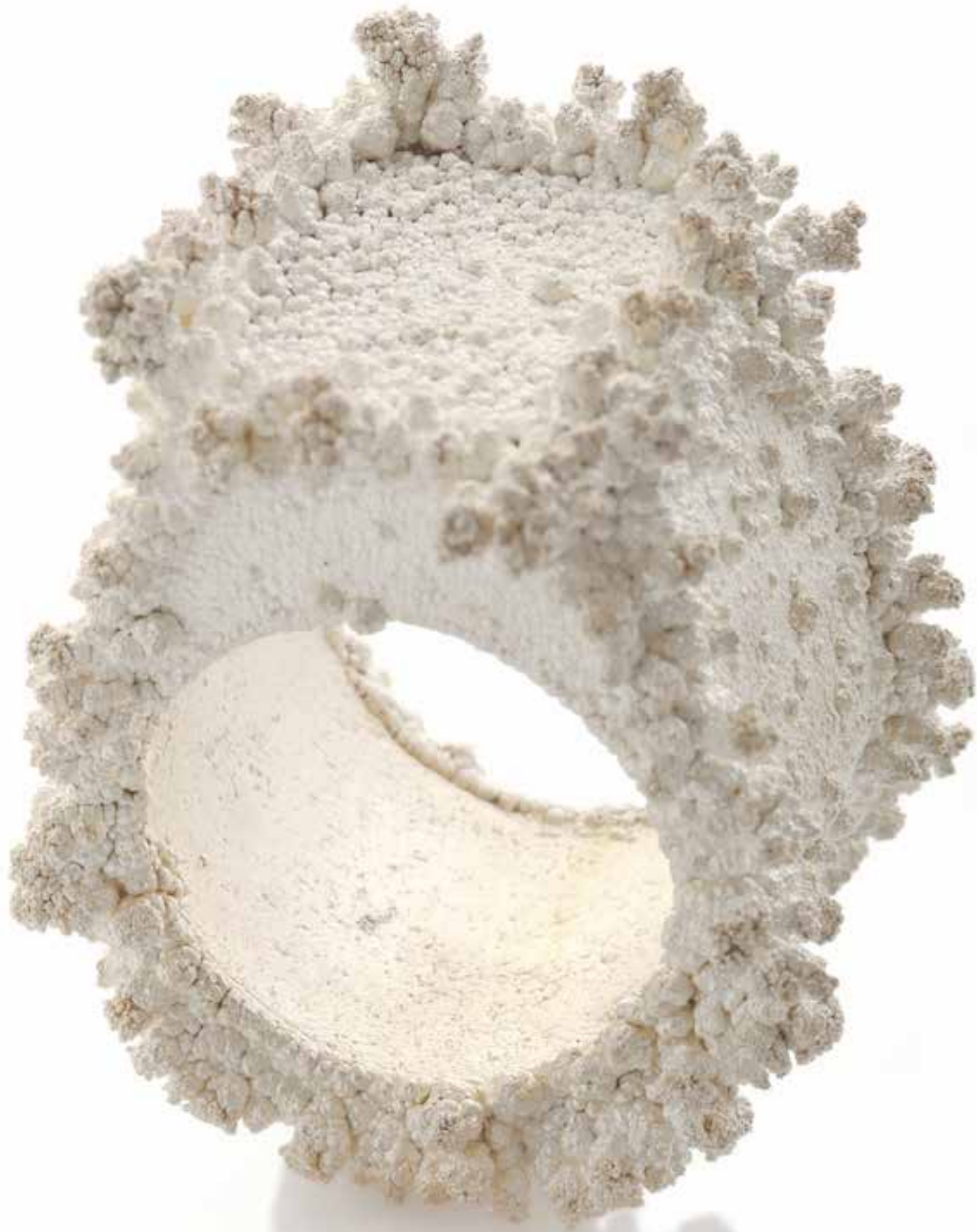
Lindsey Fontijn, Icon II, anello, ottone, rame, argento