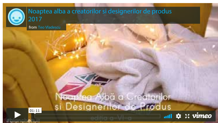
Noaptea alba a creatorilor si designerilor de produs 2017

Am avut un an extraordinar, am co-organizat conferințele de la Ambient Expo , și de la BIFE SIM alături de Romexpo, Dizain ăr și Universitatea de Arhitectură și Urbanism. Cu ultima instituție am dus colaborarea mai departe și în noiembrie am organizat Noaptea albă a creatorilor și designerilor de produs, ediția a VI-a . Proiectul l-a avut co-finanțare din partea Ministerului Culturii și Identității Naționale, și peste 82 de participanți.