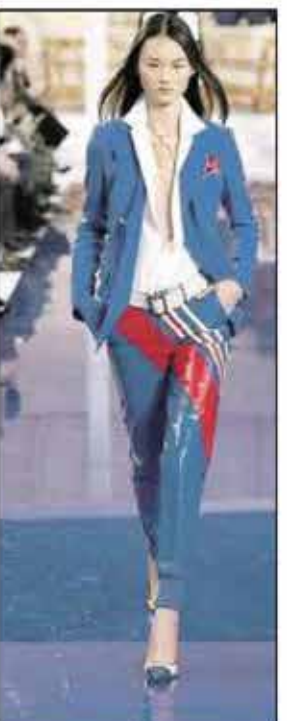
SPIRITO LIBERO Ralph Lauren leggero e glamorous, si ispira la Giamaica

Tutti i tessuti della collezione erano animal friendly. Ralph Lauren si ispira allo spirito libero e alla leggerezza glamorous della Giamaica. Le silhouettes sono caratterizzate da una sartorialità contemporanea e da linee soft sia per il giorno che per la sera. Cotoni, sete fluide e georgette sono infuse di stampe floreali, mentre righe, motivi tie dye e grafici aggiungono un tono vezzoso alla collezione. Per Victoria Beckham chic militare con una austerità adrogina dai colori sobri, con molto verde kaki, marrone e nero, la vita segnata da una grande cintura. Secondo rumors a settembre si sposterà a Londra, la sua città, per festeggiare i 10 anni del brand.