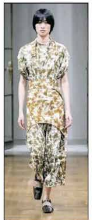
MILITARY CHIC Victoria Beckham sobria con tocchi di militare

AMO PARFUM Festa nel cuore di Manhattan per celebrare il lancio Usa di Amo Ferragamo, la nuova fragranza femminile di Salvatore Ferragamo. Celebrities e concerto delle sorelle Aly & AJ (foto)