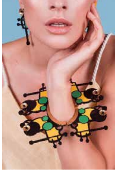
Первое фото: Серьги Zaga; второе фото: украшения Anastasia Khazyrbekava