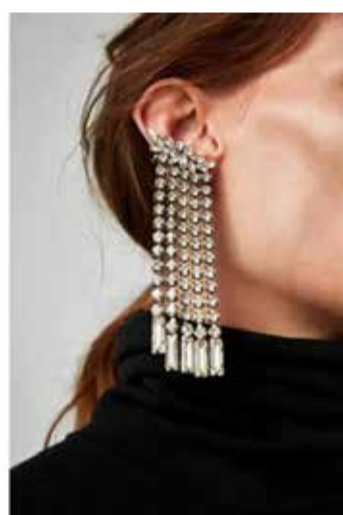
Первое фото: серьга-каффы остразами, Zaga; второе фото: серьга-каффы остразами, Zaga