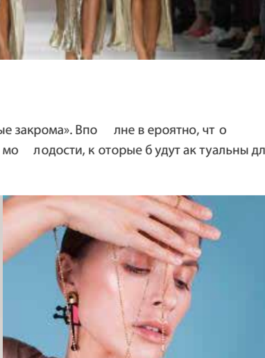
Первое фото: серьги Mango; второе фото: украшения Anastasia Khazyrbekava