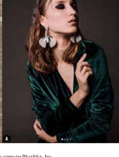
Первое фото: серьги Mila Ignatik; второе фото: серьги Ptushka_by