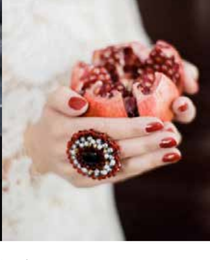
Первое фото: Кольцо Vedovka; второе фото: iven. decor