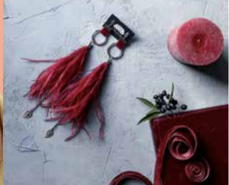
Первое фото: серьги Vedovka; второе фото: серьги Karavai