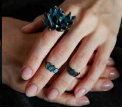
Первое фото: брошь by black salamander; второе фото: кольцо-лотос by black salamander