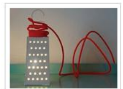
CACIO&PEPE | Lampada da tavolo