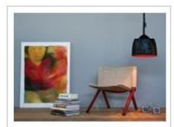
FLOWER S LAVAGNA | Lampada a sospensione