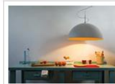
MEZZA LUNA 1 CEMENTO