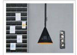
JAZZ LAVAGNA | Lampada a sospensione