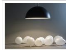
MEZZA LUNA 1 LAVAGNA