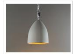
FLOWER S CEMENTO | Lampada a sospensione