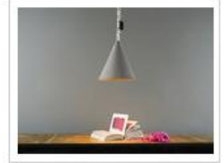
JAZZ CEMENTO | Lampada a sospensione