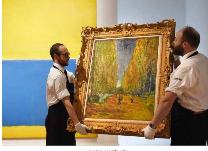
Lavorare mondo arte

Open call per artisti, scrittori, sceneggiatori, designers ed operatori culturali. Il nostro appuntamento con le segnalazioni delle offerte di lavoro nel mondo dell'arte torneranno a febbraio con una new entry: i concorsi letterari per il vostro racconto nel cassetto!