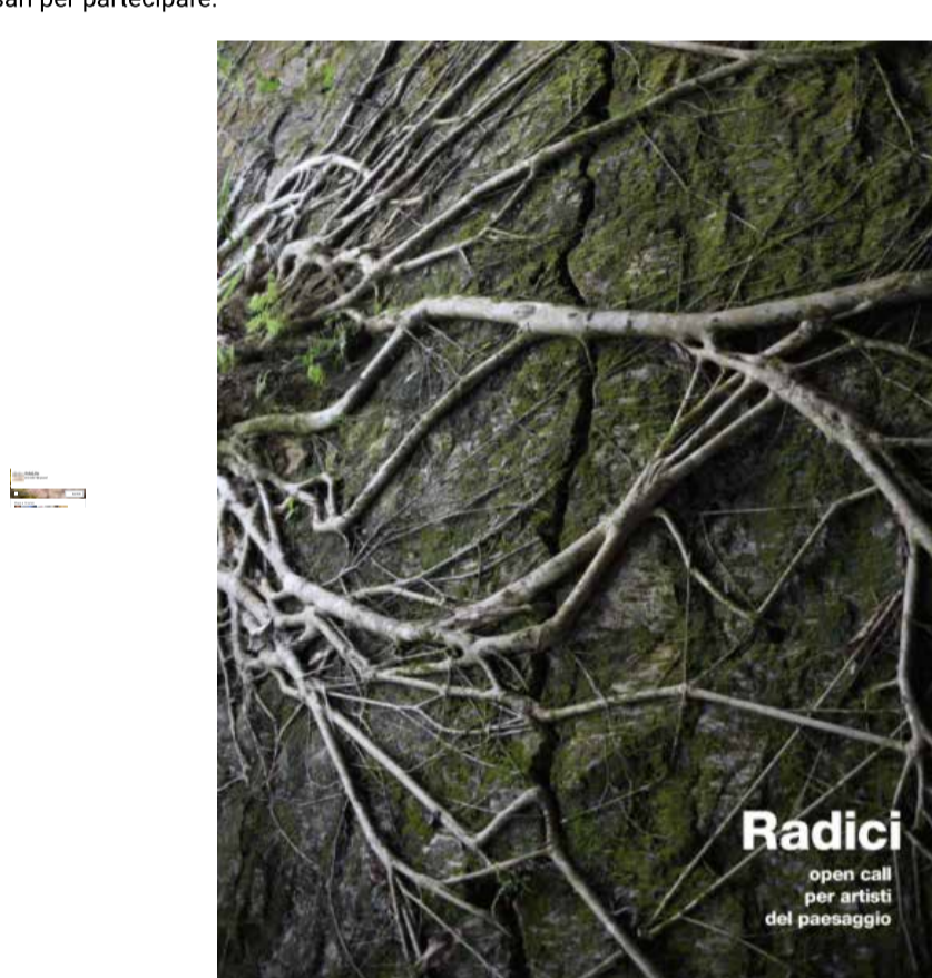
Radici- Open Call

Cliccando QU ( https://l.facebook.com/l.php?u=http%3A%2F%2Fwww.palmetta.it%2Fwp-content%2Fuploads%2F2020%2F01%2FCall-Radici.pdf%3Ffbclid%3DIwAR1Izd4LPOiC1ie9HxVsG6kKK2npSqM92I05ZcX4jRC9amfM4EcEjJUFaPA&h=AT2Z28avxrgDumZEXui7KGXULYRj3Xf7w_tQNNOEFAKXr3V0D6OE3u8fWOt6cMU6Ar4N6T4KZUKLfh7pBN-u4KaFtIhZIUf6Lk2hyQYMUoXcft_zLMt2pa_JSRG_gnTG ) trovate il bando con tutte le informazioni e i requisiti necessari per partecipare.