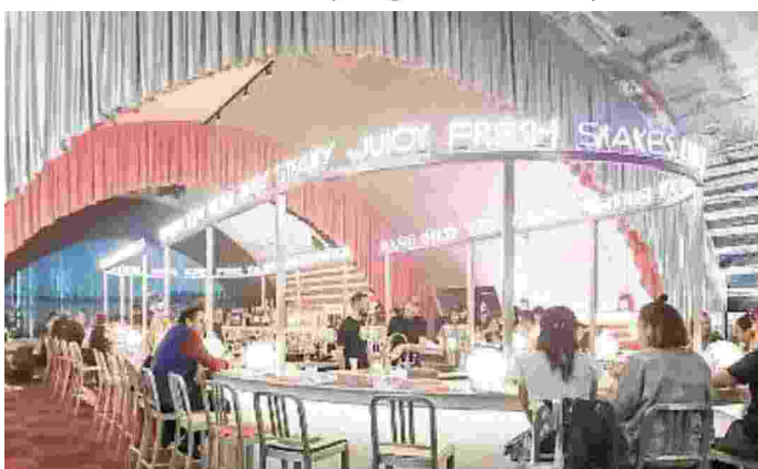
Una delle location del Fuorisalone Ventura Project in Centrale

Lo spostamento del Salone del mobile a nuove date, da aprile a giugno, sarà una bella prova di capacità organizzativa e capacità di fare sistema anche per il Fuorisalone. Perché da anni una manifestazione non esiste senza l'altra, una in fiera, l'altra spalata sui principali quartieri della città. Tutto dovrà fare quadrato intorno alla fiera più importante del mondo per il settore arredo. Se decidere di posticipare il Salone è una decisione presa da un consiglio di amministrazione, per il FuoriSalone le cose sono un po' più complesse: è una moltitudine di singoli a dover decidere, oltre che a dover organizzare con location temporanee che nel resto dell'anno vivono di vita propria e, magari a giugno avrebbero già avuto altra destinazione. Almeno mille