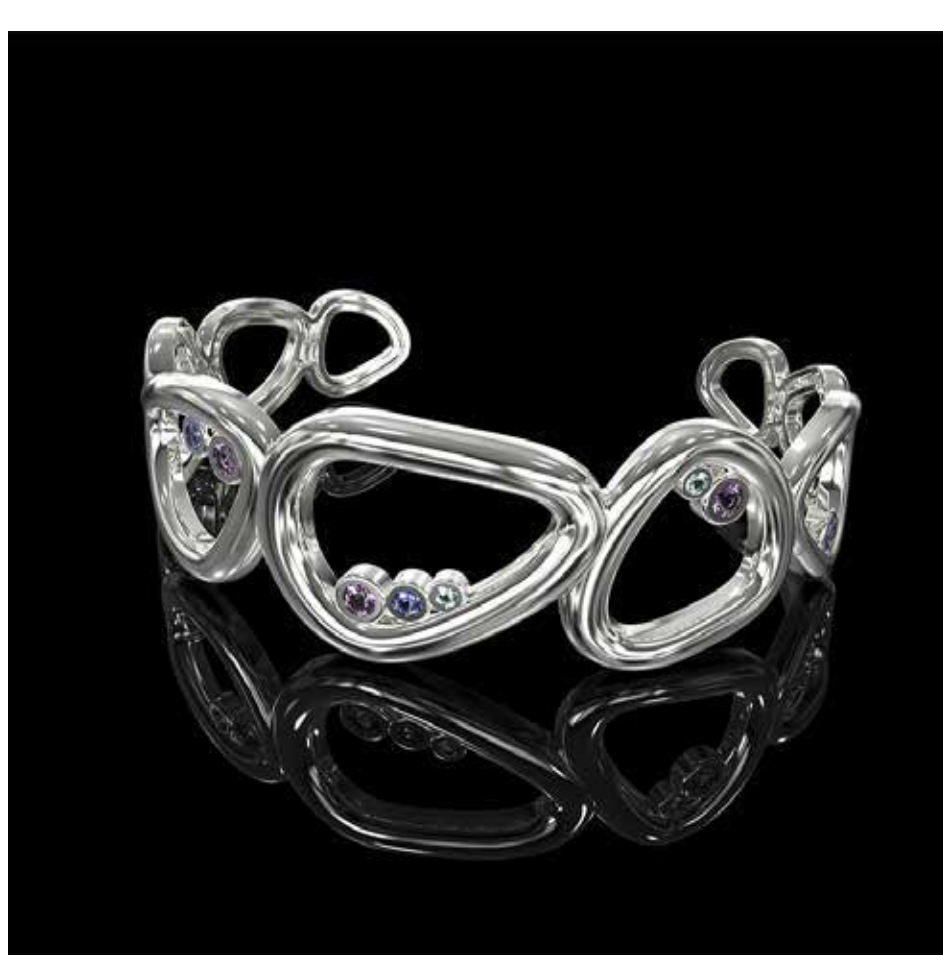
Conte di Ramello, Ritmo Collection Bracelet

Artistar Jewels conferma il suo ruolo di collettiva più ricca della kermesse con l'esposizione, presso Palazzo Bovara in Corso Venezia 51 , dei gioielli contemporanei di 200 artisti e designer provenienti da 40 diversi Paesi.