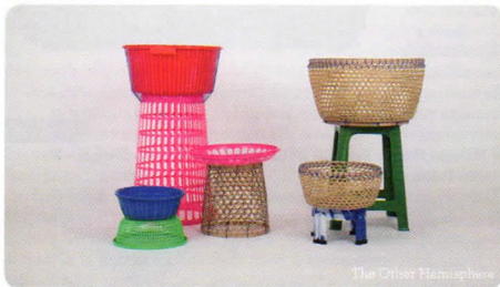
The Other Hemisphere

🕒 Opening cocktail 9 aprile (h. 20.00-22.00). Apertura al pubblico dall'8 al 13 aprile (h. 10.00-20.00; 13 aprile 10.00-18.00).