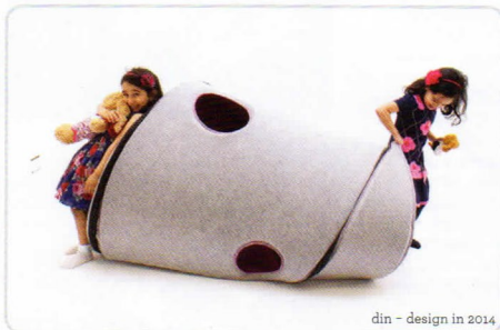
din - design in 2014

🕒 Premiazione concorso #WITH - design WITH food e cocktail party powered by Langhiparma 11 aprile (h. 19.00-22.00). Apertura al pubblico dall'8 al 13 aprile (h. 10.00-20.00).