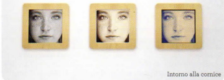
Intorno alla cornice