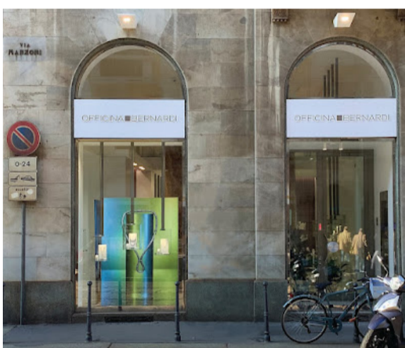
La nuova boutique milanese di Officina Bernardi