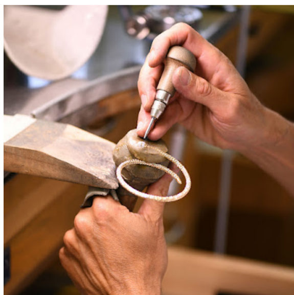
Autentica tradizione di alto artigianato orafa

di gioielli preziosi, realizzati in oro 18K con pietre scelte da gemmologi esperti che ne valutano sia la qualità complessiva sia la capacità di abbinarsi ai metalli in cui sono incastonate. Attenta alla sostenibilità e alla produzione etica di gioielli, Officina Bernardi è una "maison" di gioielleria attiva nella produzione di oreficeria in oro 18 carati, le cui collezioni sono realizzate interamente negli stabilimenti produttivi dell'azienda. L'esordio è avvenuto nel mercato statunitense, dove il marchio ha subito riscosso successo e dove è presente oggi in 800 punti vendita di fascia alta, fra gioiellerie, boutique e department store. In seguito, la distribuzione si è ampliata all'Europa e in particolare all'Italia, dapprima in gioiellerie selezionate e adesso nei due punti vendita monomarca di Venezia e Milano. Avanzati sistemi di recupero del calore per ottenere acque di processo sono già stati installati e caratterizzano le lavorazioni. Il brand trevigiano ha, inoltre, ricevuto le certificazioni ISO 14001 e i certificati RJC per l'intera produzione di gioielli in oro e in argento dal Responsible Jewellery Council.