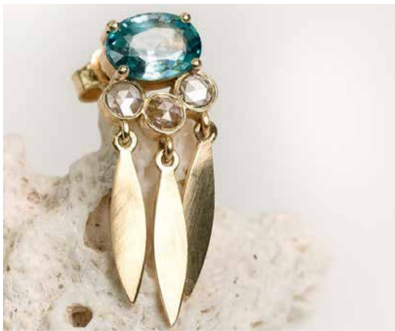
Starlight Yasmine Dreamcatcher di Alkemeya.