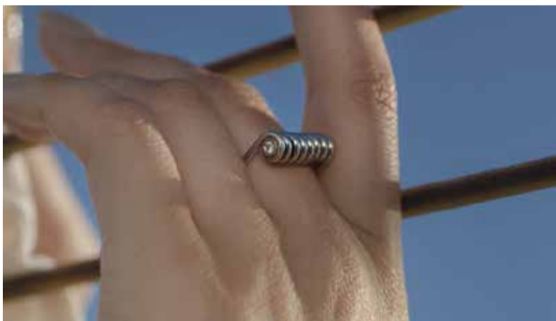
Bettina T: un gioco di rimandi duchampiano, che si esplica non solo nei nomi delle creazioni ma anche nella loro realizzazione: ogni gioiello è infatti realizzato a mano da abili artigiani romani, tradendo il proprio aspetto formale – quello di natura industriale – per diventare un autentico prodotto manuale, unico.

all'oggetto, dalla parola alla forma. “Molly”, ispirata alla molla di una molletta stendibiancheria, è un gioiello che si fa anello, ciondolo o orecchino. Resa preziosa dai metalli con cui è realizzata – a scelta argento o oro – e con la possibilità di incastonarvi un diamante o altre pietre preziose, la forma si fa tutt'altro, e il semplice oggetto industriale è celebrato in un monile prezioso. “Tin” è invece una linguetta di una lattina, che diventa mono orecchino da indossare da solo o abbinato a un punto luce, ma anche anello in argento con diamante, per un pegno d'amore diverso dal classico solitario. L'ultimo della linea è “Sfrido”, il ricciolo di scarto di lavorazione.