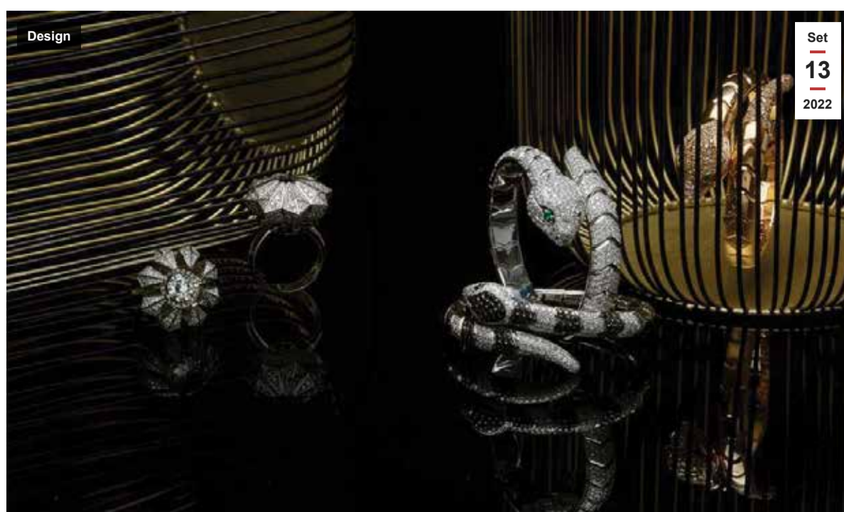
Jewels Barni Collection and Leo Pizzo The Jewelry Hub Credits Huesers Magazine

MILANO – Con 750 espositori , oltre 100 location e più di 150 eventi in programma, torna a Milano, dal 20 al 23 ottobre 2022 , la seconda edizione della Milano Jewelry Week , con un itinerario che si snoderà attraverso percorsi tematici e che coinvolgerà palazzi prestigiosi e atelier di alta gioielleria, scuole e laboratori di arte orafa, boutique di moda e showroom di design.