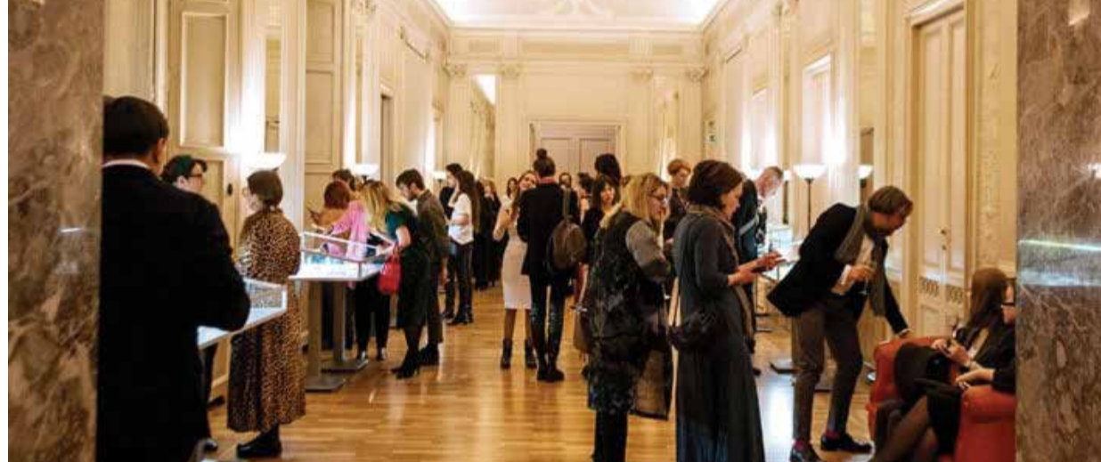
L'EDIZIONE PRIMAVERILE DI ARTISTAR JEWELS A PALAZZO BOVARA

La scuola Galdus ospiterà conferenze e un Talent show che avrà come protagonisti i lavori dei più promettenti studenti selezionati dalle scuole orafe partecipanti alla Week. Inoltre, brand come Christie's, Sotheby's, Ippolita, Sisis Jewels, Gioielleria Pederzani, Veronesi Gioielli d'Epoca e Cielo 1914 risultano coinvolte in diversa misura tra installazioni, seminari, incontri.