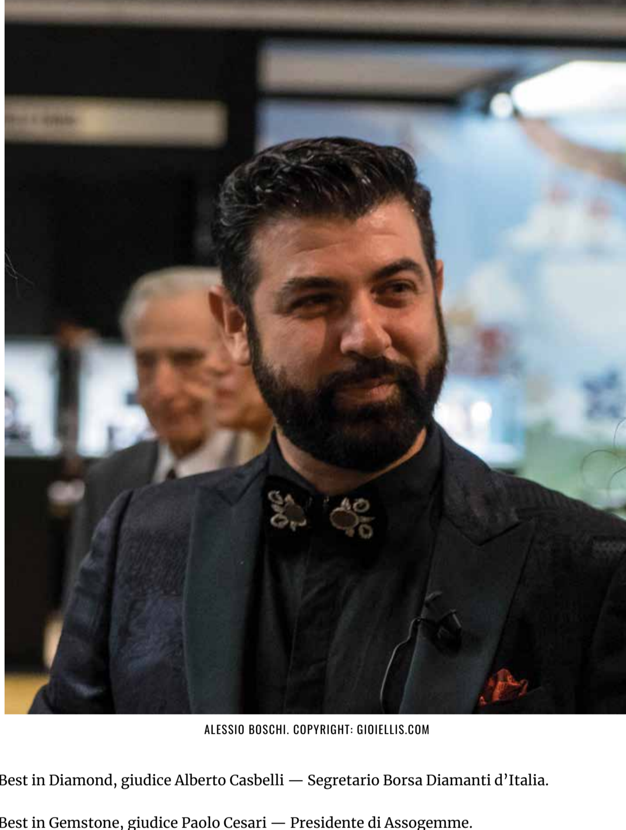
ALESSIO BOSCHI. COPYRIGHT: GIOIELLIS.COM

Gli espositori presenti alla Milano Jewelry Week parteciperanno ai premi Best in e al premio Valdo, offerto dallo wine sponsor della manifestazione, Valdo Spumanti.