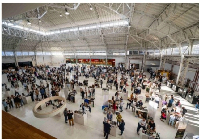
Best Wine Stars, una foto panoramica