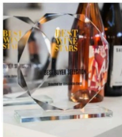
BEST WINE STARS AWARDS 2026